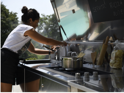
Finalmente, das Leben im Freien